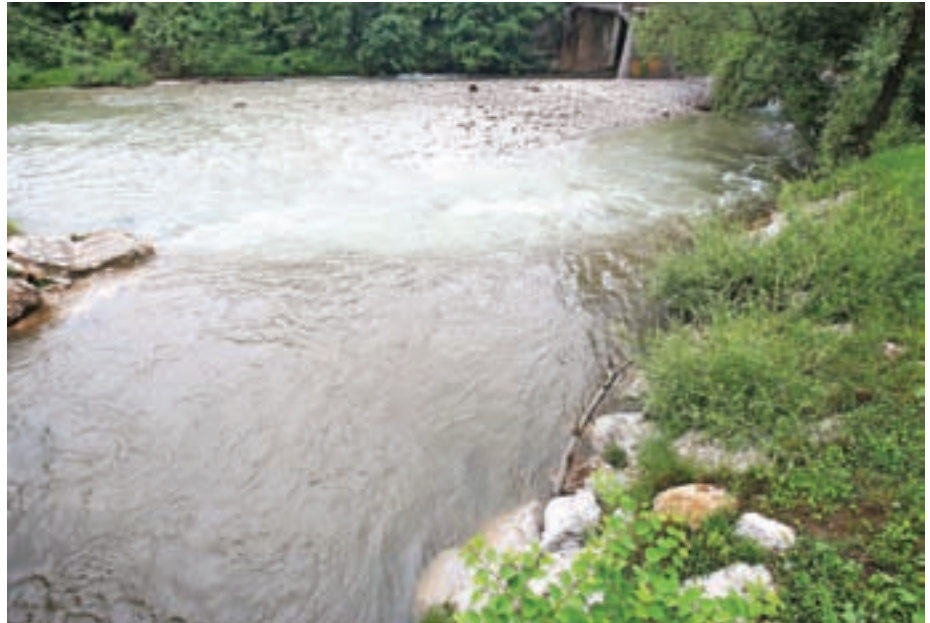
Sotočje reke Kokre in potoka Rupovščica

V zadnjih dveh letih je potekalo tudi več aktivnosti za izboljšanje stanja reke Kokre. Lotili so se evidentiranja iztokov v