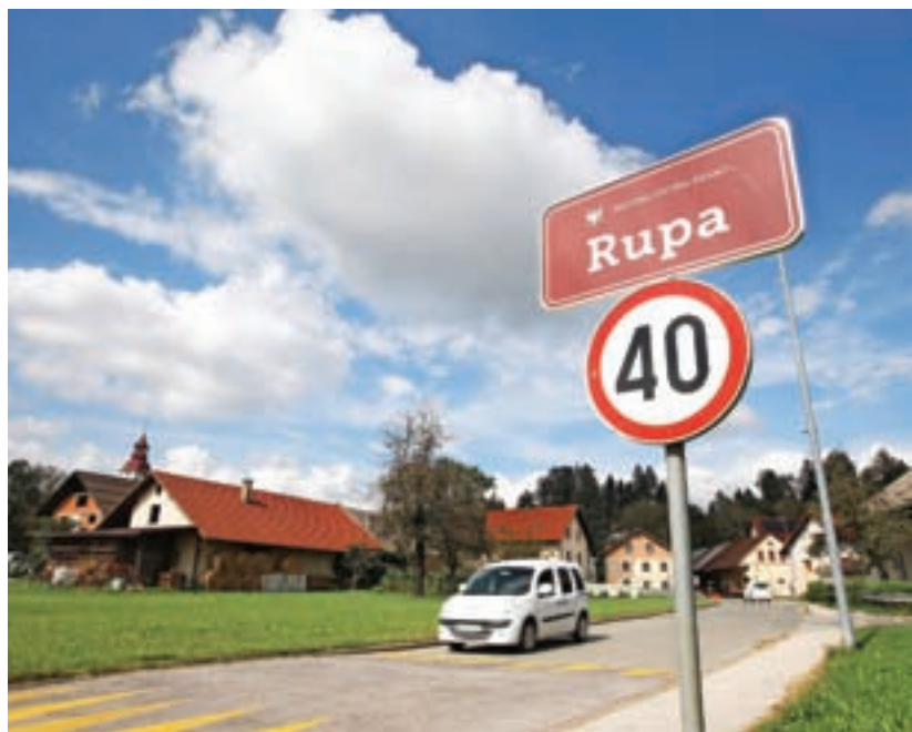
Tretja faza gradnje kanalizacije in obnove vodovoda na Rupi se bo začela spomladi prihodnje leto.

Mestna občina Kranj je letos pridobila tudi dokumentacijo za pridobitev projektnih pogojev za projekt gradnja javne kanalizacije ter obnova ceste in vodovoda na Bleiweisovi cesti pri vojašnici v Kranju oziroma na Velikem hribu. Ta vključuje tudi projektne pogoje vseh nosilcev urejanja prostora. »Sledi pridobitev pravice graditi in pridobitev gradbenega dovoljenja, nato pa izdelava projektov za izvedbo in izbor izvajalca,« napovedujejo na občini. Projekt vključuje gradnjo kanalizacije, obnovo vodovoda in po potrebi prestavitev telekomunikacijskih, električnih in plinskih vodov. Obnovili bodo tudi cesto.