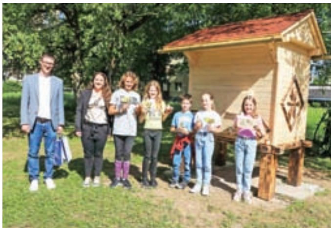
Čebelnjak so prevzeli na svetovni dan čebel.