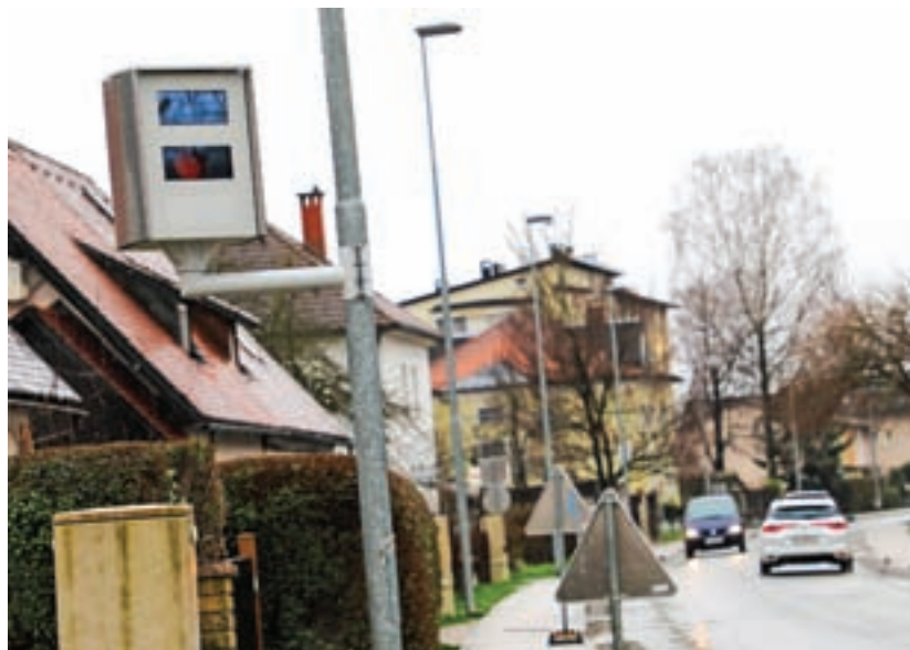
Stacionarni radar na Cesti Kokrškega odreda so postavili februarja, meritve hitrosti pa so z njim začeli izvajati v maju.

Na vprašanje, ali prisotnost stacionarnega radarja že vpliva na umirjanje hitrosti in ali ne bi bilo bolje, če bi radar obrnil v nasprotno smer, so nam z občine odgovorili: »Trenutna postavitev stacionarnega radarja ne vpliva na meritve, saj radar meri hitrost v obe smeri. Prav tako se lahko radar na drogu obrne tudi v drugo smer. Raziskave kažejo na to, da že samo postavitev stacionarnega ohišja umiri hitrost na določeni lokaciji. Glede na to, da so to prve meritve hitrosti s stacionarnim radarjem na tej lokaciji, še ne moremo oceniti, v kakšni meri se je umirila hitrost.«