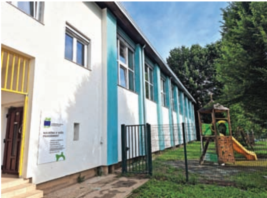
Na sanacijo telovadnice so zelo težko čakali.

Izvedbo pouka vse bolj zaznamujejo družbene spremembe, ki vplivajo na otroke. »Otroci so kratkotrajne pozornosti, bolj nemirni, težko sedijo, kar vodi tudi dinamiko dela učitelja. S to težavo se vse pogosteje srečujemo, zato bomo naslednje leto nekoliko bolj sistematično šli v projekt, da sčasoma drugače oblikujemo pouk za otroke s slabšo pozornostjo. Še več bo doživljajskega učenja zunaj, hkrati bomo skušali tudi dovolj poskrbeti, da jim bomo pozornost