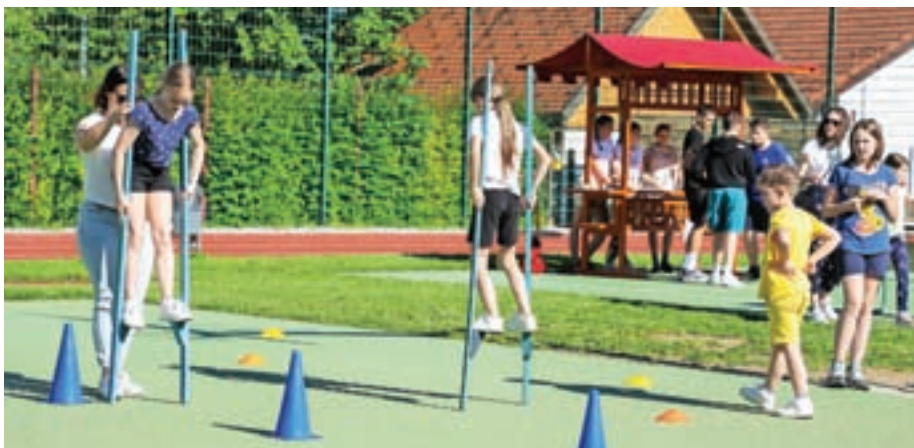
Otroci so se na zaključnem pikniku preizkusili tudi v hoji s hoduljami.