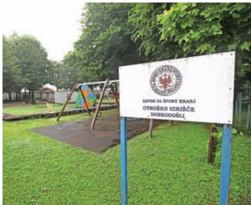
Na otroškem igrišču Gibi Gib bodo vse poletje potekale različne aktivnosti za otroke.

Lokal Gibi Gib so po požaru v začetku maja obnovili v slabem mesecu dni in tako že nemoteno obratuje.