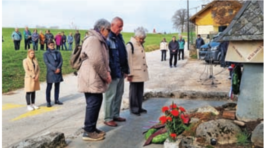
Polaganje vencev k spominskemu znamenju padlim v Šorlijevem mlinu

»Interpretacije preteklosti se vedno spreminjajo in je na podlagi gradiva nemogoče izluščiti popolno resnico. Zgodovina je pač zapletena in naš položaj v sedanjosti pomembno vpliva na to, kako gledamo na preteklost in jo ocenjujemo. Pri nas se krešejo številna mnenja o dogodkih med drugo svetovno vojno, posamezni dogodki in osebe se predstavljajo pozitivno ali negativno, in to velja tudi